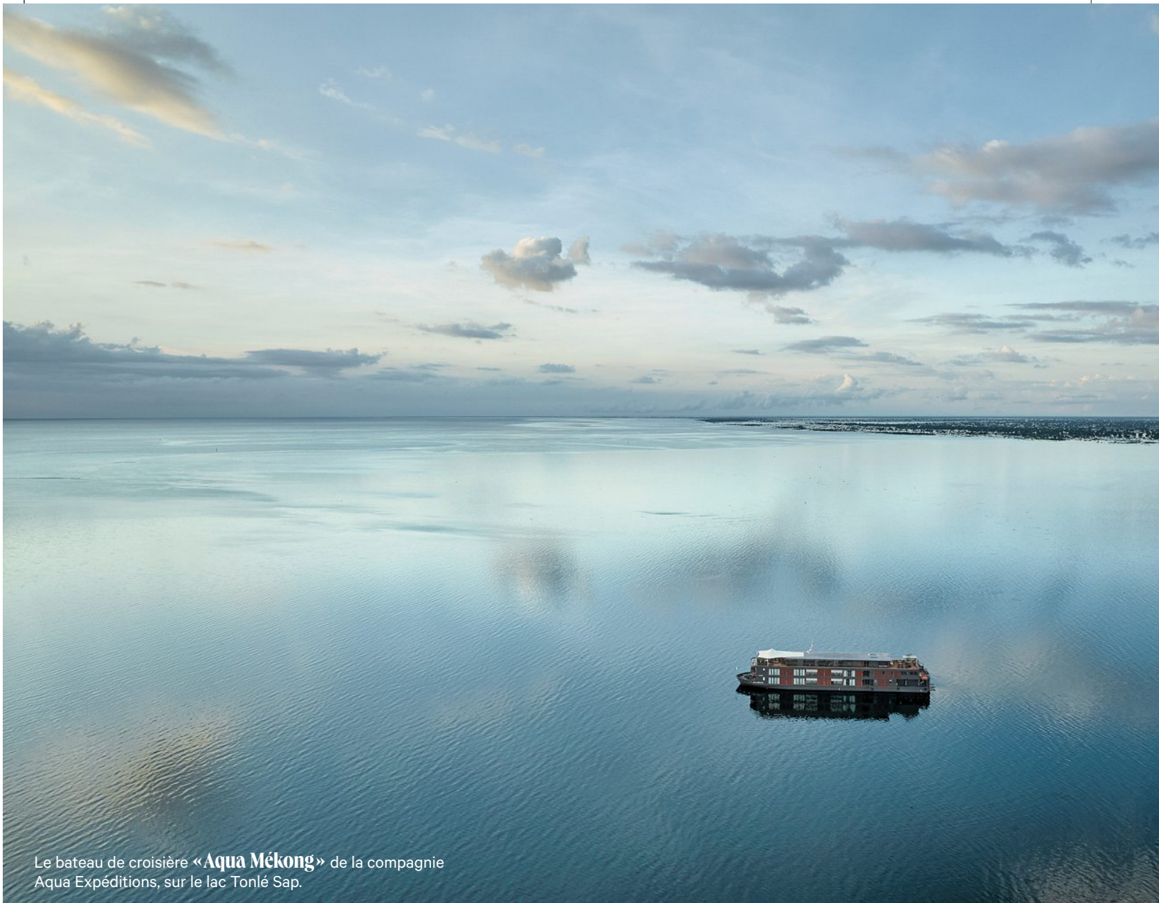
Le bateau de croisière « Aqua Mékong » de la compagnie Aqua Expéditions, sur le lac Tonlé Sap.

Au Cambodge, à la saison des pluies, la rivière Tonlé Sap inverse son cours et donne naissance à une vaste étendue lacustre ponctuée de forêts inondées et de villages flottants. À bord de l'« Aqua Mékong », nous avons embarqué pour une aventure aussi douce qu'exclusive.