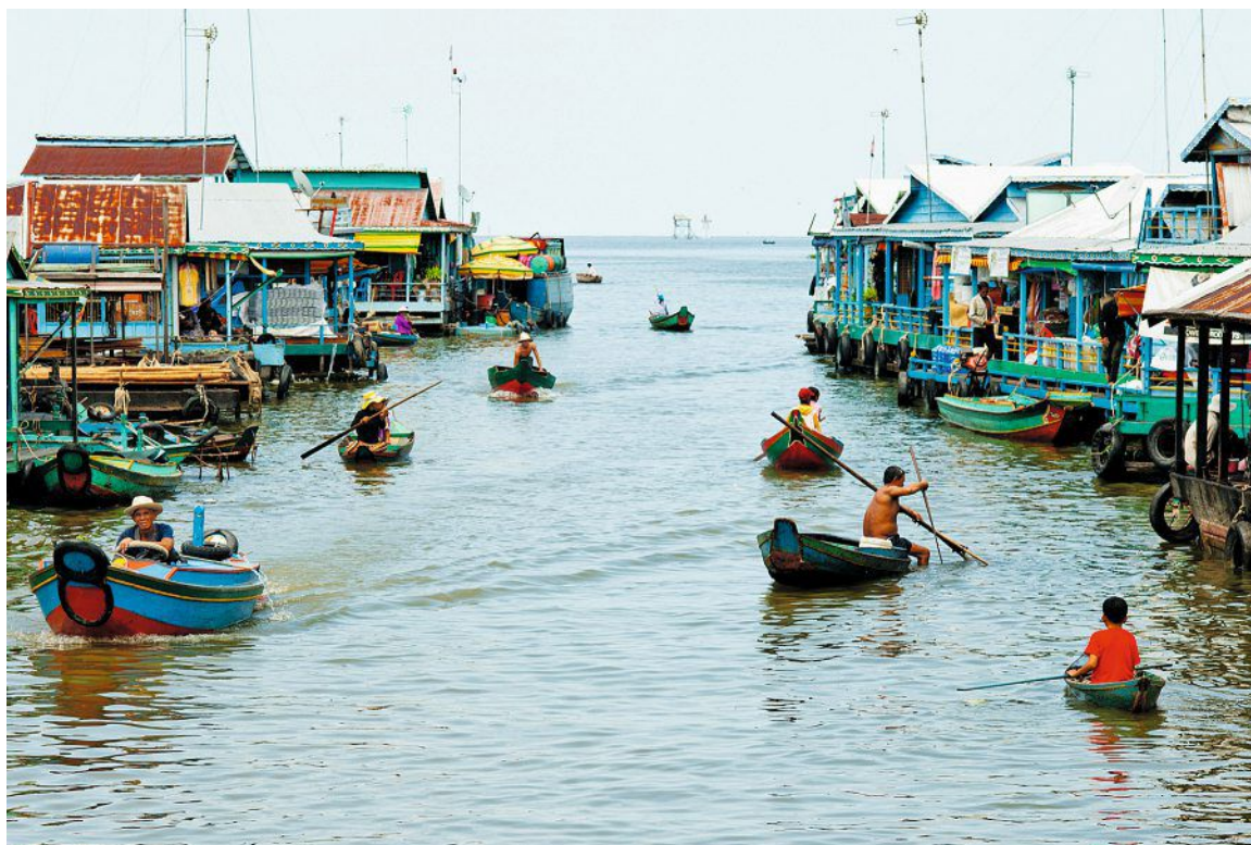
Les villages flottants abritent des communautés de pêcheurs , ravitaillées par des commerçants en pirogue.

ultraconfort que l'on rejoint la terre ferme pour partir à vélo le long des rizières, à pied ou en tuk-tuk à la découverte des temples, des stupas, des centres de méditation. À moins que l'on préfère s'engouffrer en kayak dans la mangrove.