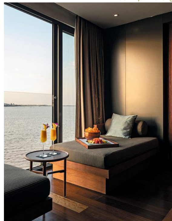
Une suite à bord de l'Aqua Mékong.

Pour appréhender ces paysages et ces modes de vie étonnants, c'est à bord d'un speed boat qu'on part à l'aventure en s'enfonçant dans les méandres de la rivière, en parcourant les villages flottants les plus isolés. C'est aussi à bord de cette annexe