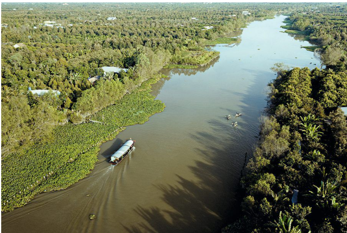
En kayak, les croisiéristes de l'Aqua Mékong peuvent partir explorer les méandres de la rivière et sa mangrove.

► notamment entre le Vietnam et le Cambodge que, en 2027, elle proposera ses premières croisières francophones. «L'idée d'origine était de profiter d'un hub comme le Machu Picchu ou ici les temples d'Angkor 6 pour imaginer un itinéraire d'aventure, hors des sentiers battus, sans pour autant transiger sur le confort. Nos passagers ne sont pas des habitués de la croisière mais plutôt des amateurs de safari ou de voyage-expédition, ce que j'appelle l'aventure facile.»